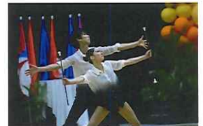
(喜田さんとのペア演技)